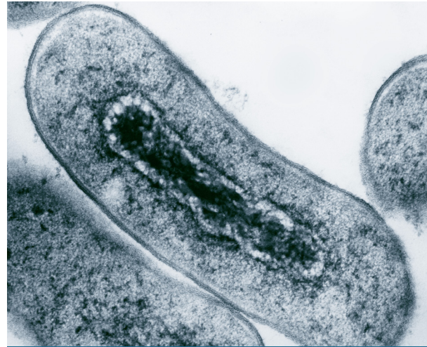
Figura 1. Sección transversal de la micrografía de electrones de la bacteria Escherichia coli . 4

Este agente bacteriano suele ocasionar cuadros clínicos de dos a tres veces por año en niños lactantes. Actualmente, se conocen 171 antígenos somáticos de E. coli , 56 antígenos flagelares y seis diferentes tipos productores de diarrea: E. coli enteropatógena (ECEP), E. coli enterotoxigénica (ECET), E. coli enteroinvasora (ECEI), E. coli enteroagregativa (ECEA), E. coli enterohemorrágica (ECEH) y E. coli enteroadherente (ECEA). 5